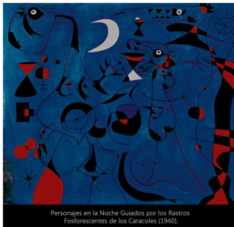
Personajes en la Noche Guiados por los Rastros Fosforescentes de los Caracoles (1940).

André Breton, ideólogo y fundador del surrealismo, considera que de todos los artistas del movimiento es Joan Miró “el más surrealista”. ¿Por qué? Porque la esencia del surrealismo (que quiere decir “lo que está por encima de la realidad”) es dejar aflorar el inconsciente, es no dejar intervenir en la creación a la razón. Este método es el llamado automatismo psíquico: el crear automáticamente, “sin pensar”. Y si bien podemos sospechar que el automatismo “puro” del que habla Bretón en sus teorías es imposible (podemos estar convencidos de que siempre se filtrará una pizca de racionalidad en toda creación), en las obras de Joan Miró podemos observar ese “fluir del inconsciente” en la asociación libre de formas, colores, cosas. Dejo el siguiente enlace para saber más sobre quién era Joan Miró: https://es.m.wikipedia.org/wiki/Joan_Mir%C3%B3