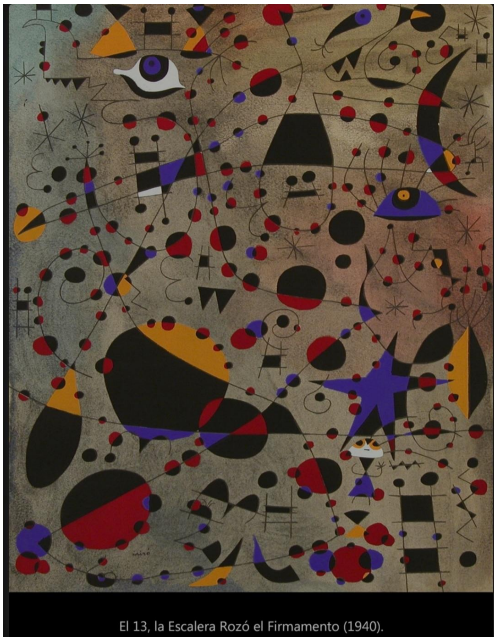
El 13, la Escalera Rozó el Firmamento (1940).

Las imágenes a continuación son una serie de pequeñas obras sobre papel (23 en total), con signos que representan astros, pájaros y mujeres conformando un cosmos, un mapa celestial. Un cielo al que a veces llega una escalera. Es una escalera para escaparse: Miró siente la necesidad de evadirse de la horrorosa realidad que significa el estallido de la Segunda Guerra Mundial. Se escapa hacia el universo que él mismo inventa.