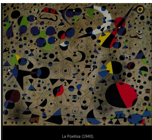
La Poetisa (1940).