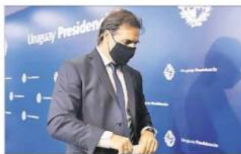
DECISIÓN. El presidente Lacalle Pou se retira tras los anuncios.