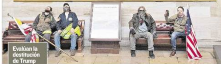
Evalúan la destitución de Trump

El Congreso de Estados Unidos retomó anoche la sesión de certificación de la victoria del demócrata Joe Biden, luego del asalto al Capitolio. Demócratas y republicanos manejan que el vicepresidente Mike Pence invoque la Enmienda 25 de la Constitución y destituya a Trump.