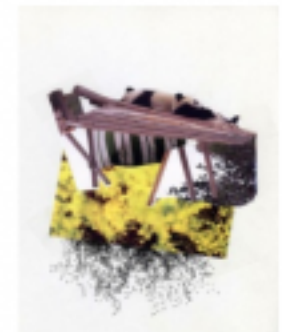
silencio. osos durmiendo by gabriela pleserchia