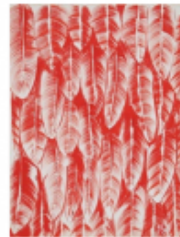
lovely feathers if eliza sunderland, 1941